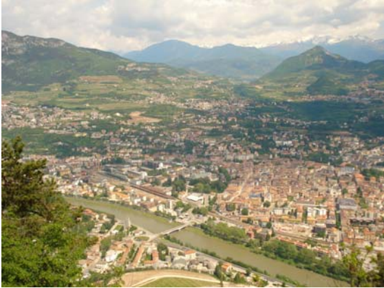
Trient aus der Vogelperspektive.