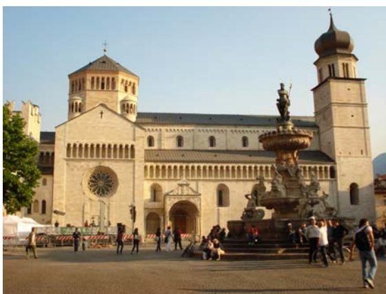
Der Trienter Dom.

Die im Verlaufe der vergangenen anderthalb Jahre versammelten Beiträge für den Band Present tensions. European writers on overcoming dictatorships (Budapest: CEU Press, 2008) tragen nicht allein die Handschrift ihrer Autoren. Sie sind auch das Ergebnis der gemeinsamen Reflektionen während des Projektes. Die