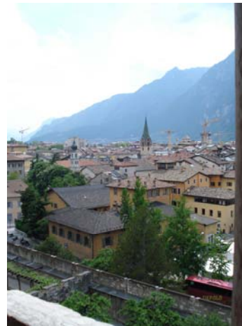
Der Blick schweift ins Umfeld des eindrucksvollen Castello del Buonconsiglio.

Tabus bewegt, tatsächlicher Grenz- und Rechtsverletzungen schuldig machen muss, um bleibende Bedeutung zu erlangen. Im Streben nach einem kohärenten und progressiven Selbstbild, das eine deutliche Abhebung von Konkurrenten ermöglicht, läuft gerade der sich als Avantgardist und Provokateur verstehende Künstler Gefahr, die eigene fragmentierte Identität zu verschleiern. Interessanterweise folgt die Schöpfung und